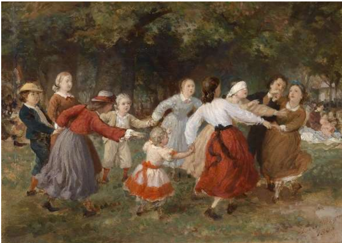
Ferdinand Laufberger, Das Blinde-Kuh-Spiel, 1965 © Otmar Rychlik