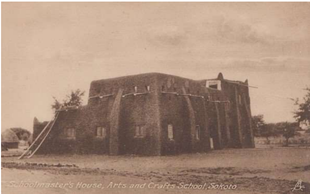
Schoolmaster's House, Arts and Crafts School, Sokoto undatierte Postkarte