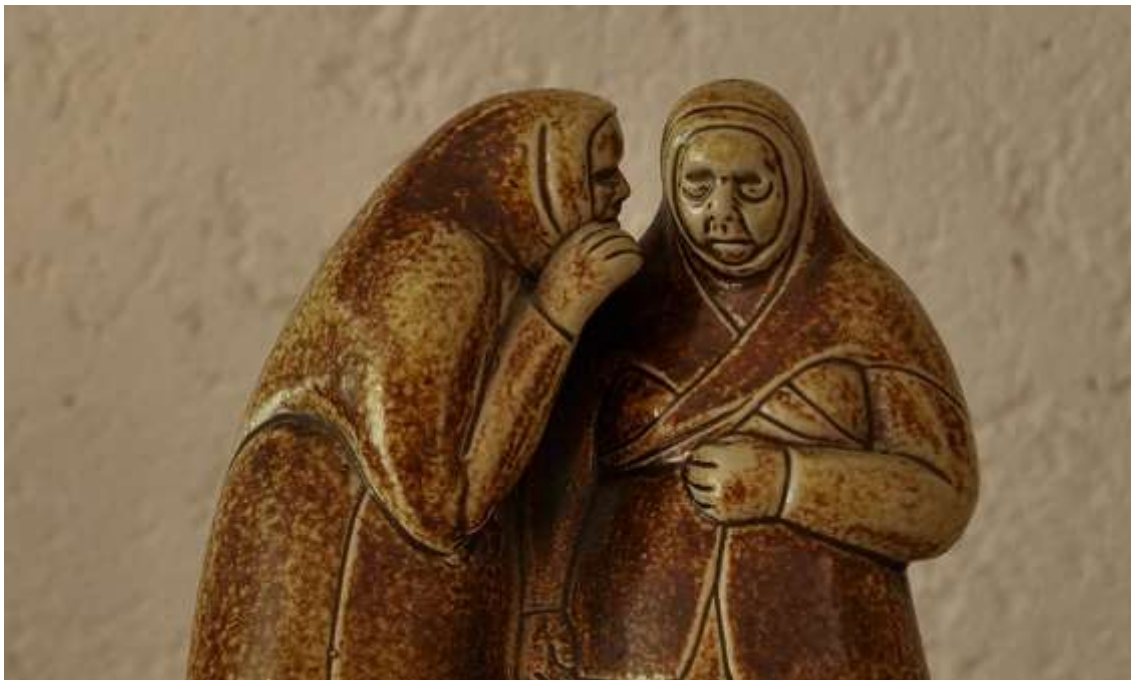
Hans Wewerka: Klatschbasen (Schwätzende Marktweiber), um 1910, salzglasiertes Steinzeug, Modellnummer T35 [Detail]