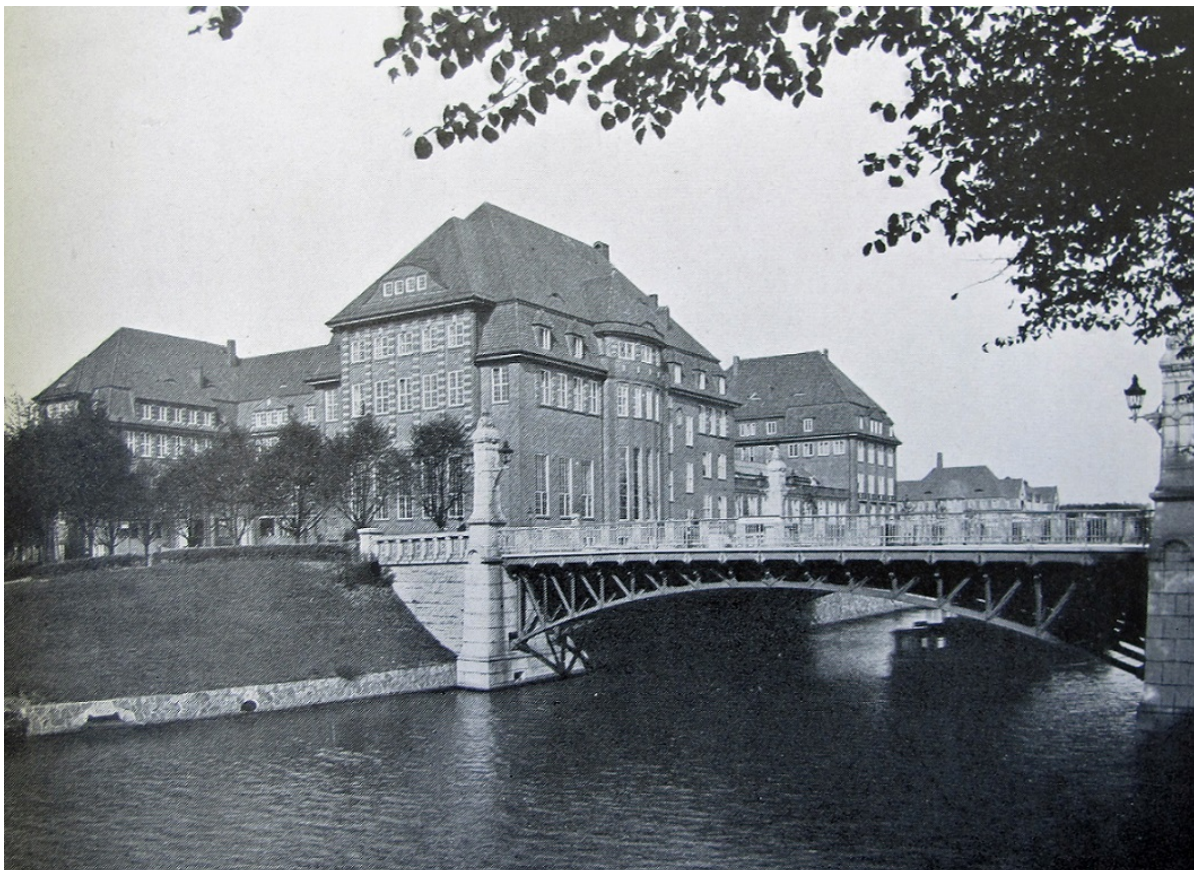
Neubau der Staatlichen Kunstgewerbeschule Hamburg am Lerchenfeld, Ansicht von der Eilenau / The new building of the State School of Decorative Arts Hamburg at the Lerchenfeld, view from the